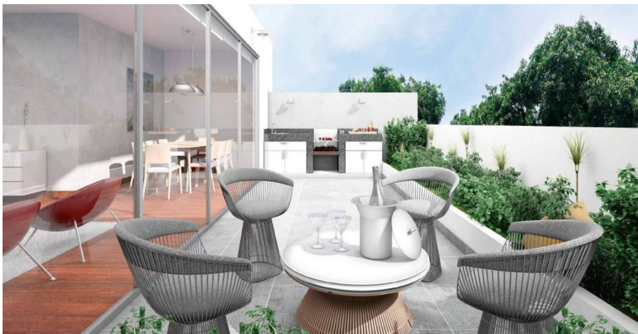
Vista / Terraza