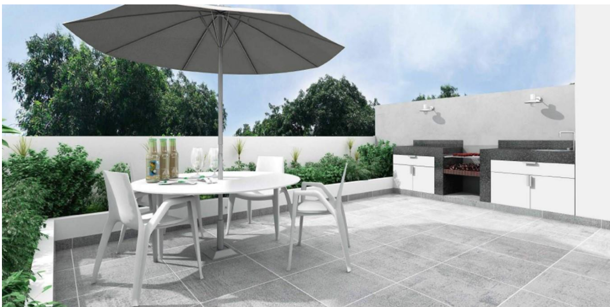
Vista / Terraza Duplex