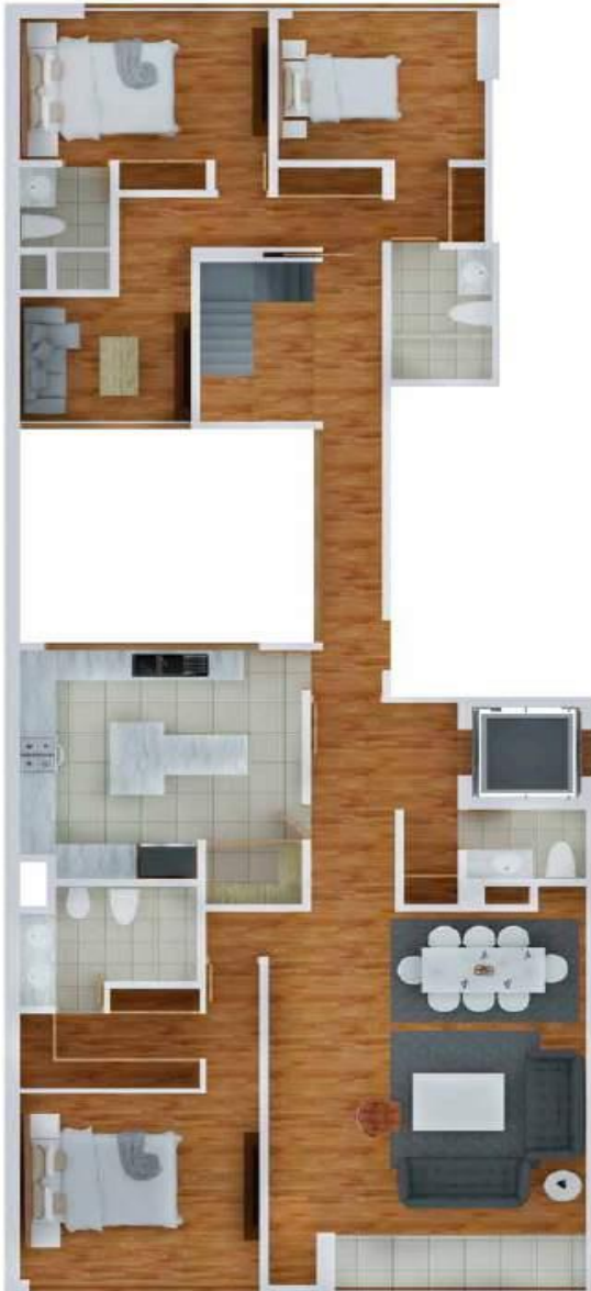
Duplex Primera Planta