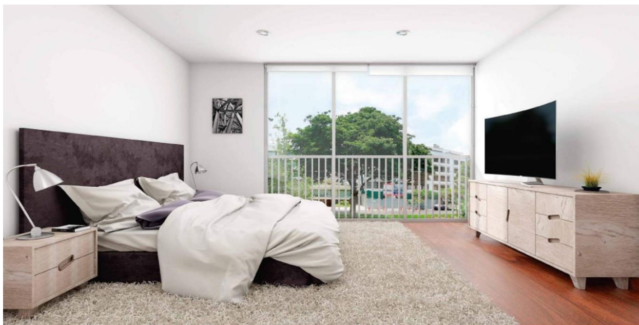
Vista / Dormitorio Principal