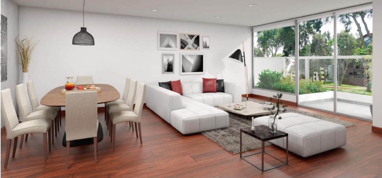
Vista / Sala / Comedor