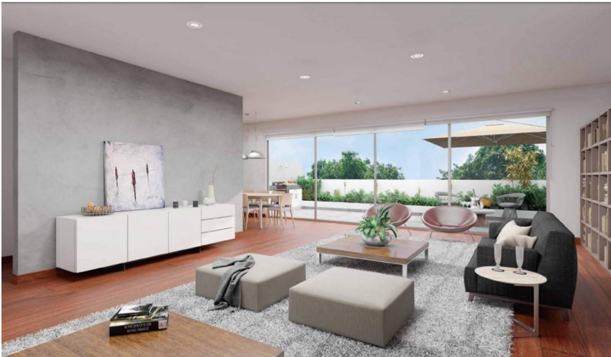
Vista / Sala de Estar Duplex