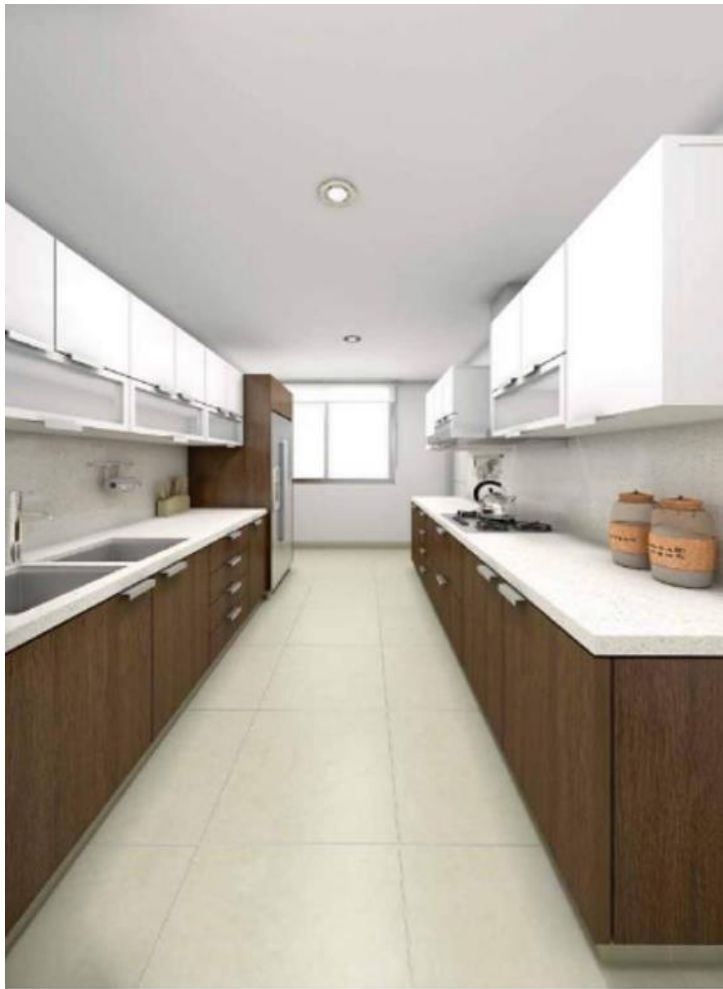
Vista / Cocina Típica